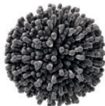
Quitosano procedente de Aspergillus niger

Botrytis cinerea es un hongo patógeno y necrotrófico responsable de la enfermedad conocida como podredumbre gris y causante de grandes pérdidas económicas en la industria del vino año tras año, reduciendo la cosecha, deteriorando las uvas y por tanto disminuyendo la calidad de los mostos y vinos. Es una de las enfermedades que más daño causan en el viñedo, atacando a todos los órganos verdes aunque principalmente en los racimos. Cuando se dan las condiciones climáticas adecuadas, principalmente alta humedad y temperaturas templadas, se propaga con gran facilidad. LaVigne BOTRYLESS™ reducirá el impacto de los daños causados por este hongo, reforzando las defensas naturales de la vid y limitando la dispersión de la infección.