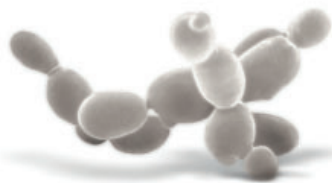
Levadura Saccharomyces cerevisiae (Grupo Lallemand)

Un déficit excesivo de agua reducirá la actividad fisiológica de la vid, pudiendo llegar incluso a límites que no permitan la recuperación del aparato fotosintético de la hoja, produciéndose una senescencia y abscisión tempranas, lo que conllevará una peor maduración de los racimos, un incremento de su exposición directa a la radiación solar y una menor acumulación de sustancias de reserva en la planta. LalVigne PROHYDRO , aplicado de forma preventiva a las condiciones de estrés hídrico, mejorará la adaptación y resistencia de la vid al déficit excesivo de agua e incrementará su recuperación tras los periodos de estrés hídrico.