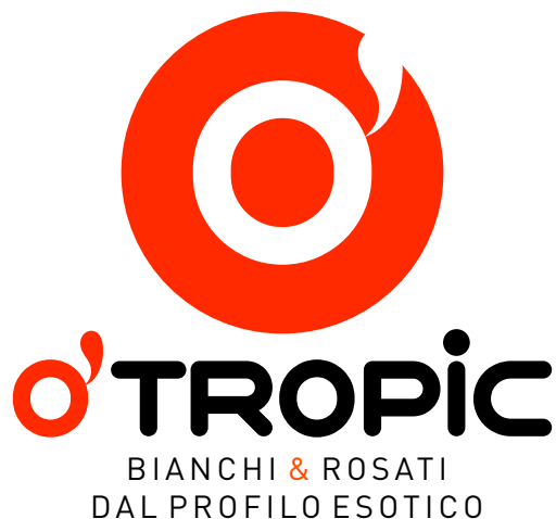
Effetto della nutrizione con O'Tropic® Syrah Rosé - R&D ICV

Per bianchi e rosati dal profilo esotico