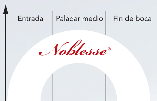
Impacto de Noblesse® en boca

→ Participar y modificar el equilibrio coloidal del vino: